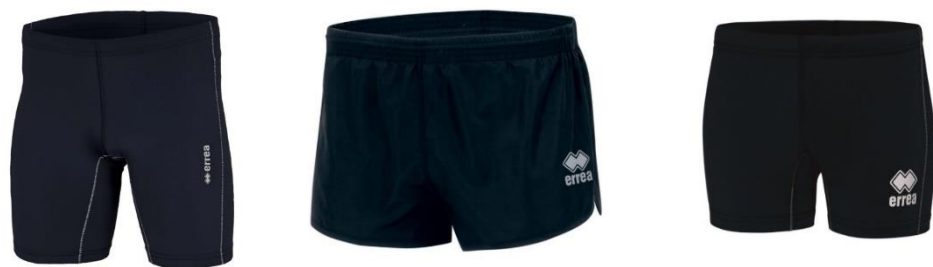
PANTA RUNNING TEAM Uomo o Donna